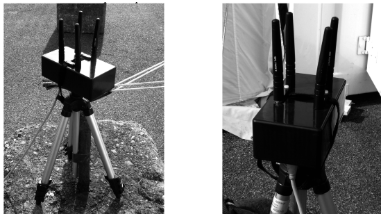
Рис. 3. Антенна система зв'язку з БПЛА за принципом MIMO

Основною умовою успішного застосування MIMO-систем, як відомо, є стаціонарність коефіцієнтів передачі радіоканалу з моменту їхнього оцінювання до завершення передачі масиву даних. Зрозуміло, що для малошвидкісних БПЛА ці умови дотримати набагато простіше, ніж для швидкісних, однак при прийомі сигналів у режимі відсут-